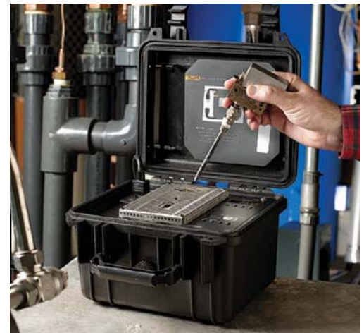
Somit ist es kein Problem, doppelt so schnell zu arbeiten.

Tip: Während Sie eine Temperatur am Transmitter-Sensor prüfen, kann der zweite Block für den nächsten Sollwert erhitzt oder gekühlt werden.