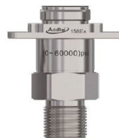
AT158 Ex Druckmodul – zur Verwendung mit ADT 260 Ex (Bodenmontage)