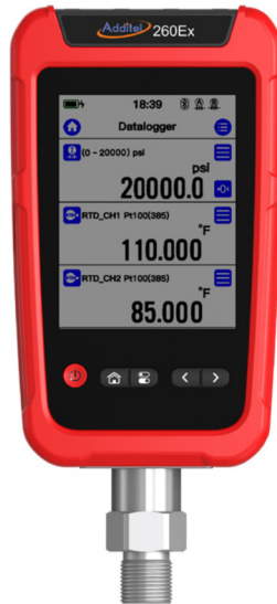
Additel 260Ex mit ADT158Ex Modul