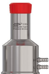
ADT161EX-Druckmodule, siehe ADT 161 Datenblatt für weitere Infos

Anmerkung: [1] Für kundenspezifische RTD-Kabellängen über 30 Meter (100 Fuß), die die Klasse B einhalten, kontaktieren Sie bitte Additel.